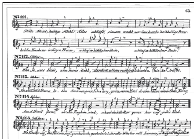
Johann Hinrich Wichern, Unsere Lieder , 1844, Notenheft