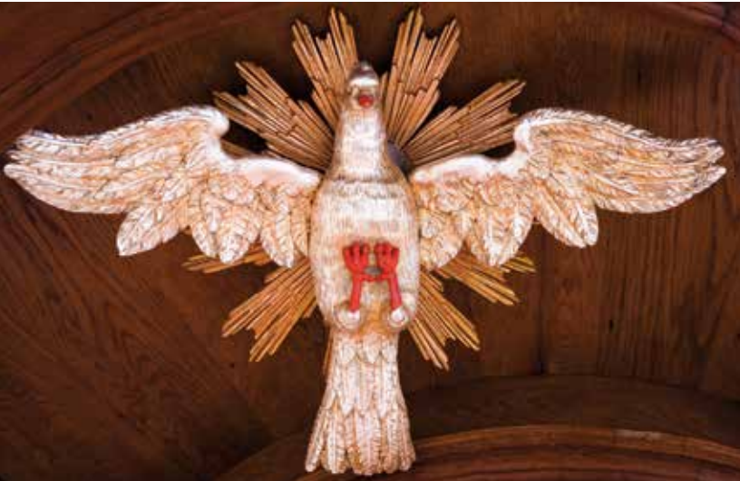
Symbol Heiliger Geist im Deckel der Kanzel der Heiliggeistkirche – ... vielleicht daß die Vögel die erweiterte Luft fühlen mit innigerm Flug.