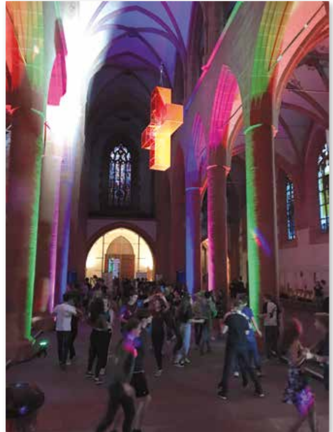
Tanzende Jugendliche an Christi Himmelfahrt