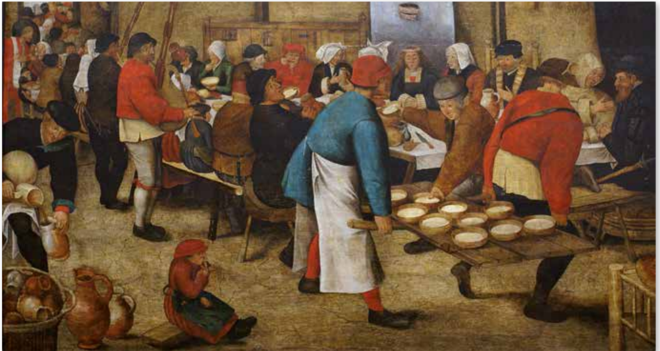
Bauernhochzeit Pieter Bruegel d. Ä. (ca. 1568 bunt eindrucksvoll, Gemeinsamkeit beim Essen und Beisammensein)

⇒ Wir suchen und vertreten gemeinsame Interessen. Literaturabend in Providenz: hier wurde ich zum Mitmachen ermutigt, ich erinnere nicht mehr, von wem. Das war sehr