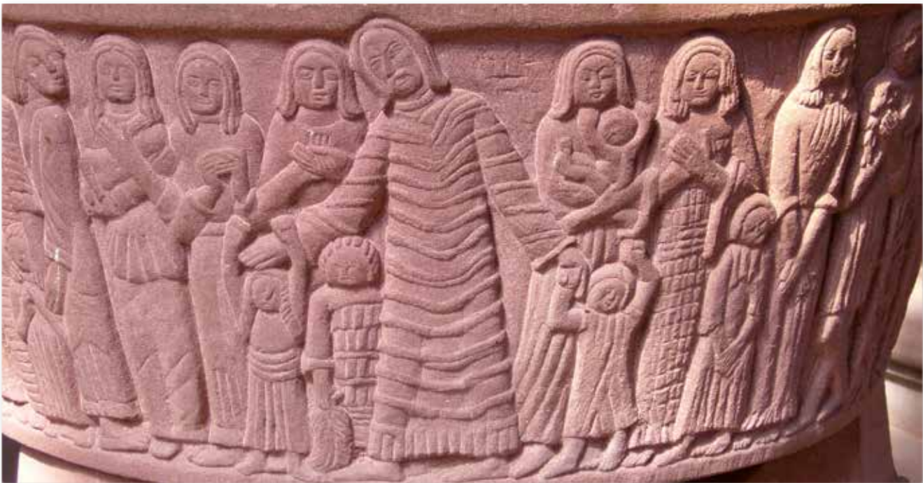
Taufbecken mit um Jesus versammelten Eltern und Kindern

Wir waren sehr viele, wir kannten uns bestimmt nicht alle mit Namen, aber das gemeinsame Singen, die Ziele unseres Jugendbundes, an Albert Schweitzers Ehrfurcht vor dem Leben orientiert, die Freundschaft mit einigen von diesen vielen Leuten, das alles trug bei mir dazu bei, dass ich damals ohne Zögern sagen konnte: „Ja, wir sind eine Gemeinschaft!“