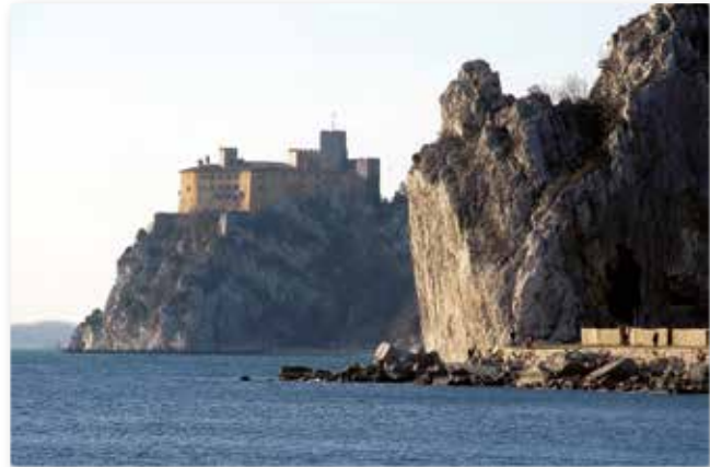
Schloss Duino in Oberitalien, Entstehungsort einiger der Duineser Elegien

kennt nicht Der Panther ? – Wenige – Und wer versteht dieses Gedicht nicht als Beschreibung eines Tieres, das in Gefangenschaft leidet? – Noch viel Wenigere!). Nicht mehr zu sehen, nicht mehr anzuschauen, nicht mehr Bekanntes zu erfahren, ist als Ziel und Motiv des späteren Werkes Rilkes erkennbar: „Und so drängen wir uns und wollen es leisten, / [...] / wehe, was nimmt man hinüber? Nicht das Anschauen, das hier / langsam erlernte, und kein hier Ereignetes. Keins. / [...] / [...] also / lauter Unsägliches. Aber später, / unter den Sternen, was solls: die sind besser unsäglich. / Bringt doch der Wanderer auch vom Hange des Bergrands / nicht