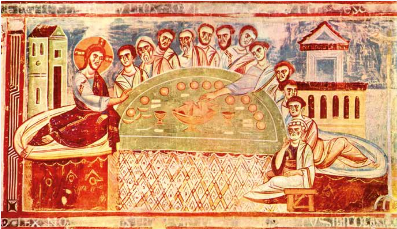
Fresco in Sant' Angelo in Formis bei Capua, (um 1100 bunt, sehr schlicht und wunderschön!)

verein, Turnverein, ja, Hausgemeinschaft und vieles mehr. Es bedeutet mir gegenseitige Wertschätzung und Respekt, Zugehörigkeit und Verlässlichkeit, Anregung, Vertrauen bis hin zur Geborgenheit.