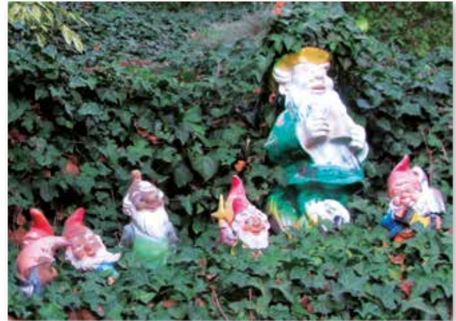
Am Wegrand des Philosophenwegs findet man etwas verborgen die Sieben Zwerge als Gartenfiguren.

Auch in Kleinasien, Griechenland und Makedonien entstanden schon im ersten Jahrhundert n. Chr. erste christliche Gemeinden, wobei die Verkündigung der Evangelien wesentlich durch die missionarischen Reisen des Petrus sowie des Paulus dorthin verbreitet wurden. Hierbei richtete sich vor allem Petrus – aus sprachlichen Gründen – an die jüdischen Gemeinden, die dort bereits in Synagogen Gottesdienste hielten (Apg 13, 14). Im Gegensatz zu Petrus und dessen Jerusalemer Kirche erreichte Paulus, der des Griechischen mächtig war, auch Heiden (Apg 13, 12; 15, 3; 11, 19-21). Die Apostelgeschichte erzählt nichts darüber, ob die Missionsbemühungen des Petrus und Paulus auch