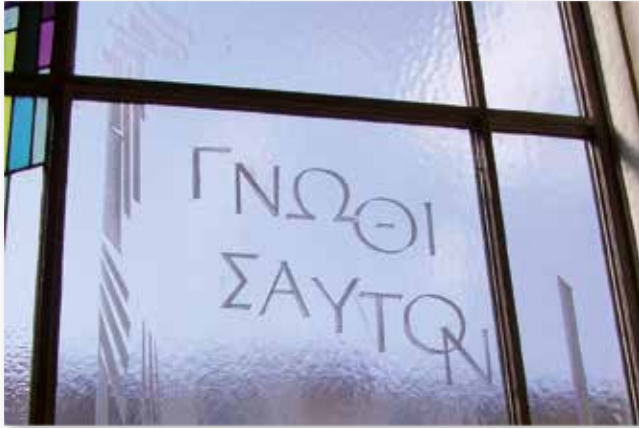
Gnoti seauton! – Erkenne dich selbst! auf einem Fenster der Stadt Ludwigshafen

eine Hand voll Erde ins Tal, die Allen unsägliche, sondern / ein erworbenes Wort, reines, den gelben und blaun / Enzian. [...] / [...] .... aber zu sagen , verstehs, / oh zu sagen so , wie selber die Dinge niemals / innig meinten zu sein. Ist nicht die heimliche List / dieser verschwiegenen Erde, [...]“ ( Die Neunte Elegie )