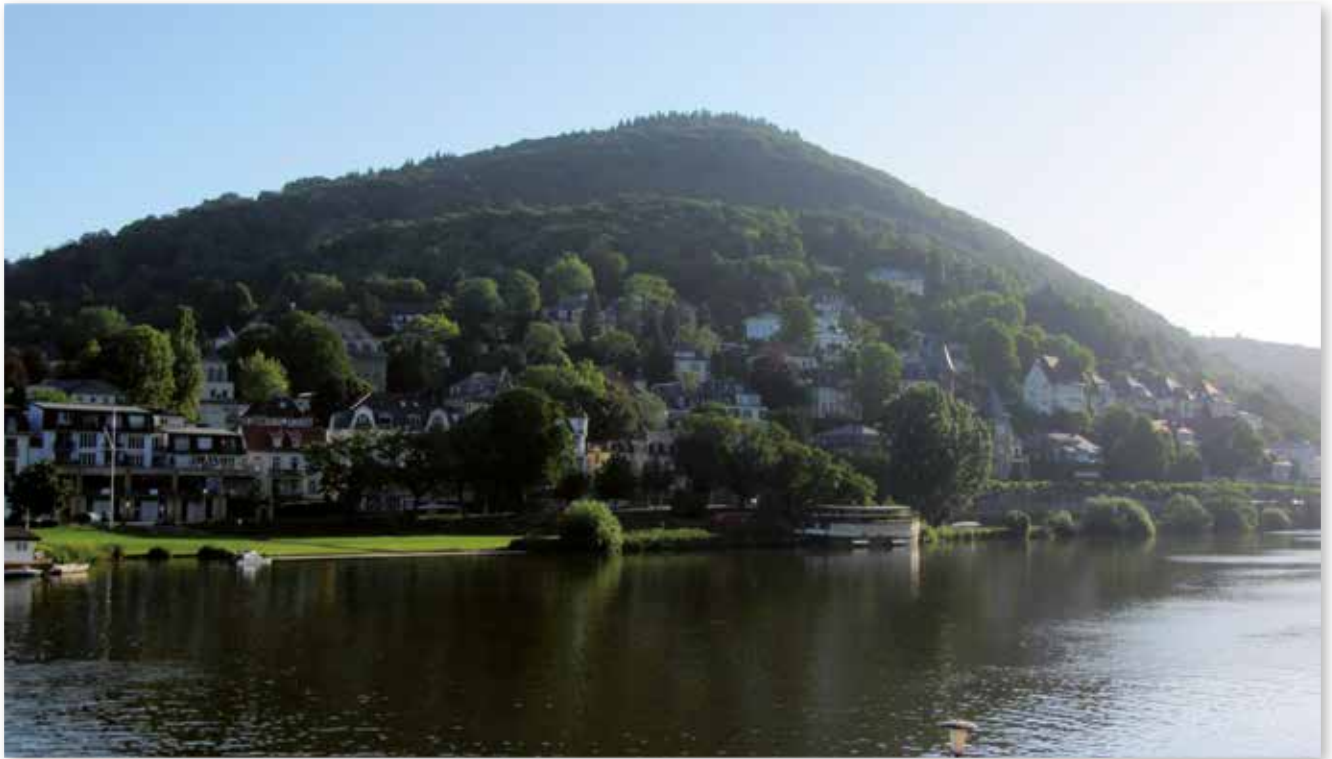
Blick auf den Heiligenberg mit dem Philosophenweg

I n dem Märchen „Schneewittchen“ von den Gebrüder Grimm flieht Schneewittchen vor der böswilligen Königin, weil diese sie wegen ihrer Schönheit so sehr beneidet, dass sie ihr den Tod zuführen möchte. In den Bergen findet sie im grazilen Haus der sieben Zwerge einen Zufluchtsort