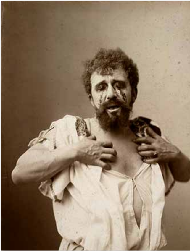
Der niederländische Schauspieler Louis Bouwmeester als geblendeter König Ödipus in Sophokles' Drama

diesem Motiv nicht. Denn ein Angeschaut-Sein ist nur in der Nacht möglich: „Warum überredet uns der Tag, / daß wir hier dem Mangel unterliegen, / wenn sich diese starken Nächte biegen / von der Schöpfung weltigem Ertrag?“ (aus: Gedichte an die Nacht ). Wo nicht Blindheit ist, da