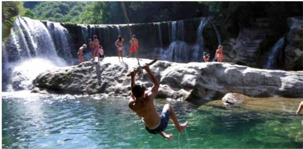
Am Großen Wasserfall von Saint Laurant le Minier