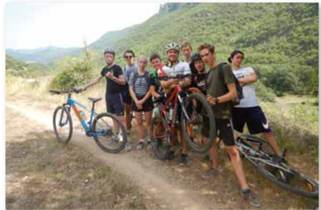
Begleitete Fahrrad-Touren durch die Berge

Ansonsten gab es neben Badespaß an verschiedenen Wasserstellen und Wasserfällen die sportlichen Programm-Highlights der letzten Jahre – Klettern am Höhenklettersteig