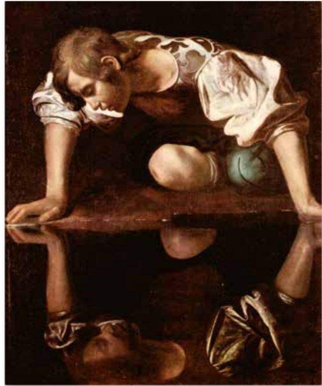
Michelangelo Caravaggio: Narziss

Freiheit und Stärke unserer Talente, Gaben und Kräfte zu erinnern und danach zu handeln.