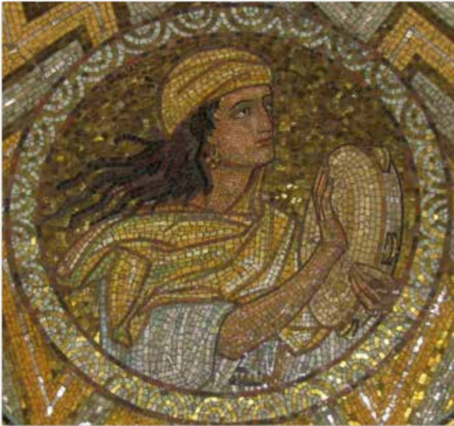
Miriam, die tanzende Prophetin nach dem Auszug des Volkes Israel; Dormition-Synagoge in Jerusalem; Foto: Deror Avi

Mit dem Aufkommen des Chassidismus in Osteuropa im 18. Jahrhundert gewann der Tanz für die jüdische Bevölkerung eine große Bedeutung. Der chassidische Tanz nahm die Form eines Kreises an, symbolisch für die chassidische Philosophie: „Jeder ist gleich, jeder ist ein Glied in der Kette, der Kreis hat keine Vorder- oder Rückseite, keinen Anfang oder Ende.“ Zuerst wählten die Tänzer ein langsames Tempo, und als die Musik schneller wurde, hielten sie die Arme nach oben und sprangen in die Luft, um spirituelle Ekstase zu erreichen.