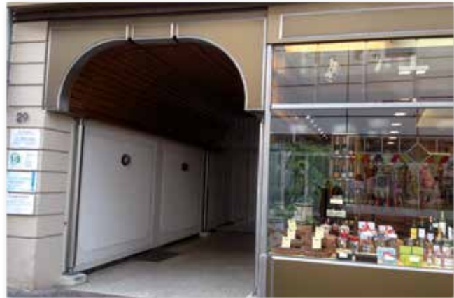
Sitz des ambulanten Hospizdienstes des Diakonischen Werks Heidelberg: Hauptstraße 29

Die Ehrenamtlichen begleiten schwerkranke und sterbende Menschen im Raum Heidelberg. Sie besuchen die Betroffenen zuhause, im Pflegeheim oder auf der Palliativstation des Vincentiuskrankenhauses. Zum ehrenamtlichen Team gehören Frauen und Männer mit ganz unterschiedlichen Lebens- und Berufserfahrungen, die teilweise aus dem Beruf ausgeschieden oder noch berufstätig sind. Ihnen allen ist gemeinsam, dass sie Zeit mitbringen und die Bereitschaft, die Erkrankten auf einem Stück ihres Weges zu begleiten und sich auf die unterschiedlichsten Bedürfnisse einzustellen. Oft wünschen sich die Betroffenen einen Gesprächspartner, weil sie ihre Angehörigen nicht mit ihren Sorgen belasten möchten oder weil sie keine Angehörigen und/oder Freunde mehr haben. Auch wenn keine Gespräche mehr möglich sind oder wenn einfach alles zu viel ist, ist es für