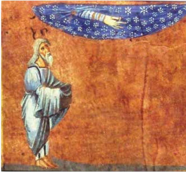
Abraham erhält seine Verheißung unter dem Sternenhimmel (Wiener Genesishandschriften, 6.Jh)

Über Schuld und Verstrickung hinaus, Mord und Totschlag, Lug und Trug, vom Bösen, vom Dunkel und den tiefsten aller menschlichen Abgründe – hin zur Vergeltung und zur Auferstehung mit und durch Jesus Christus, seinem Sohn – stellt uns Gott die Erlösung vom Tod und das Ewige Leben in Aussicht.