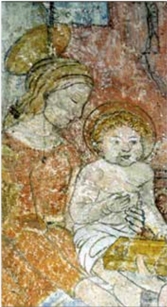
Abb. 1: Fresko in Mariapfarr (Ausschnitt)

neues Problem. Dass aus dem „hochheiligen Paar“ einfach nur „Eltern“ werden (vgl. Luk 2,41) widerspricht katholischer Volksfrömmigkeit, denn Joseph war spätestens nach Entstehen der Legende von der Jungfrauengeburt als Vater und damit als Elternteil undenkbar. Er durfte bei der Huldigung der drei Könige bestenfalls hinter einer Wand versteckt heimlich zuschauen wie auf dem Altarbild von Mariapfarr (Abb. 2).