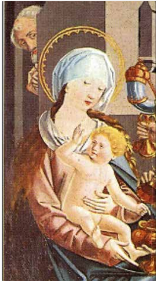
Abb.2: Tafelbild von M. Reichling am Hochaltar in Mariapfarr (Ausschnitt)

seiner Mutter, wie er die Huldigung der drei Könige entgegennimmt (Abb. 1). In derselben Kirche gibt es noch heute am Hochaltar ein spätgotisches Tafelbild des Malers Reichling, das ebenfalls die Anbetung des üppig blond gelockten Kindes durch die drei Könige zeigt (Abb. 2).