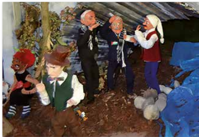
Netanjahu, Abbas und der deutsche Michl (mit verklebtem Mund)

Die Frauenabteilung im „Faulen Pelz“ schuf den Engelschor. Dessen Instrumente sind mit feinen Flügeln bestückt und verweisen so auf den Jubel der himmlischen Heerscharen. Ebenfalls in der Höhe zeigen Akrobaten ihre Luftnummern zur Freude der Untenstehenden. Unübersehbar, unüberhörbar ist der Ruf des Engels, der verkündet, dass heute (und nicht gestern) der Retter, der Messias geboren ist. Eine gerade demonstrierende Studentengruppe hätte diese Botschaft fast überhört. Es gibt auch Proteste gegen Stuttgart 21, gegen Braune Sümpfe und für die Amnestie von Edward Snowden. Die Krippe wird jedes Jahr aktualisiert. So wurde eine Justitia eingefügt, die den kirchlichen Missbrauchsskandal thematisiert. Das geschundene Kind auf ihrer Waage ist schwerer als der Bischof. Auch die Seenotrettung im Mittelmeer ist dargestellt durch das ertrunkene Kind Alan Kurdi und durch Carola Rackete als Kapitänin der ‚Sea Watch 3‘. Dort in der Nähe findet sich auch Mutter Teresa als Trösterin. Die Klima-Aktivisten sind auch in der