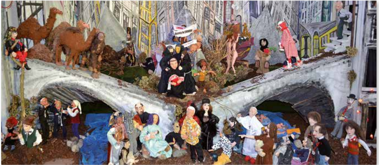
Die Krippe unter der Alten Brücke