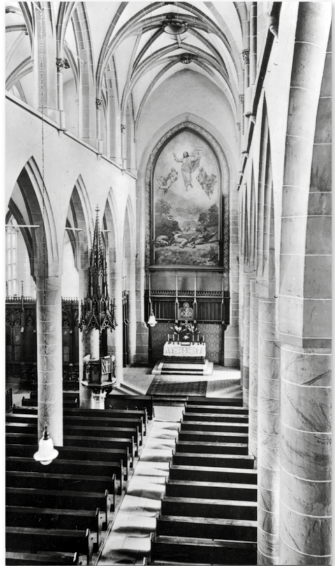
Innenraum der Heiliggeistkirche mit Scheidemauer (1936)

Der Text ist entnommen aus: „Die Heiliggeistkirche zu Heidelberg“, hrsg. von Pfr. W. Keller