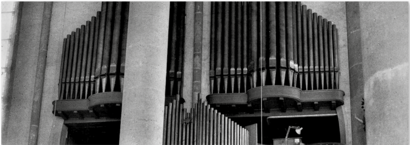
Die Orgel im Wandel der Zeit. Hier: die vorherige Schwalbennestorgel im Chorraum der Heiliggeistkirche