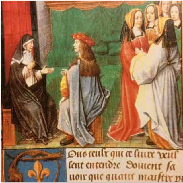
Abelard und Heloise nach einer Abbildung aus dem 14. Jahrhundert

Liebe sich wandeln und erneuern. Heloise versichert ihrem Mann und Vater ihres einzigen Kindes in nie endender Zuneigung und grenzenloser Liebe ihr Begehren und ihre Treue.