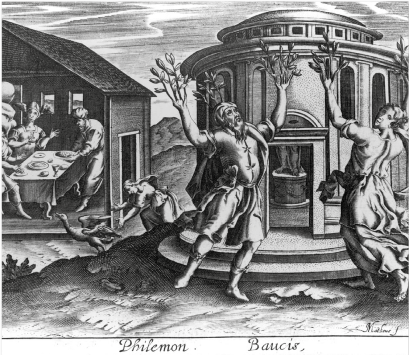
Philemon und Baucis. Die an den Armen wachsenden Äste symbolisieren die Metamorphose des Ehepaars zu verwurzelten Bäumen