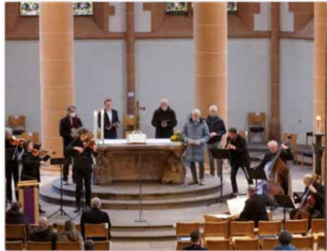
Aufführung von Arvo Pärts Johannespassion

Der musikalische Gottesdienst fand in diesem Jahr wieder um drei Uhr, also zur Todesstunde und damit dem Beginn