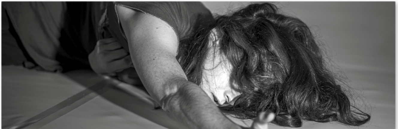
Little Sorrows