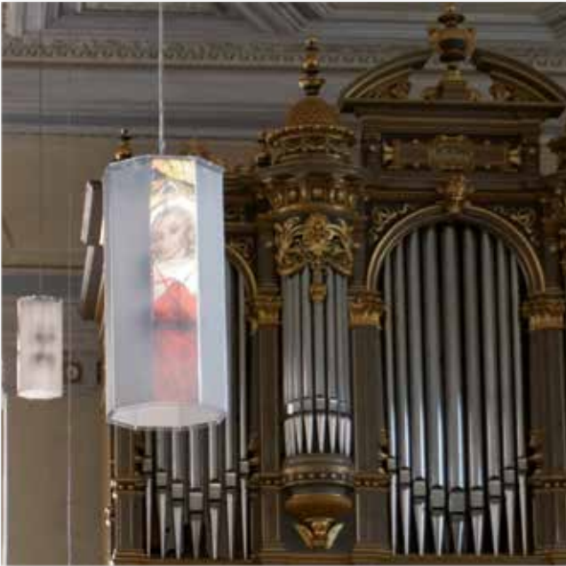
Die Burkhard-Orgel und – im Spiegel der Lampe – das Christusfenster. Beides steht sinnbildlich für (die) Romantik

gekommen hören wir Orgelmusik von Bach. Für viele wird auch das schon romantisch sein. Der Kenner wird jedoch pointiert darauf verweisen, dass es sich genau genommen um das Barock handelt und es deshalb noch nicht romantisch ist.