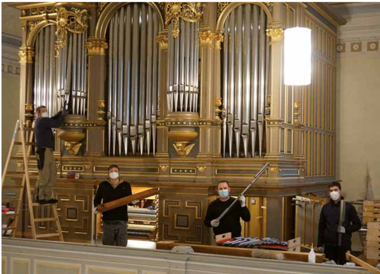
Die Orgelbauer der Firma Göckel beginnen mit dem Wiedereinbau aller Orgelpfeifen. Die vorderen, sichtbaren Orgelpfeifen sind nun wieder auf Hochglanz poliert.