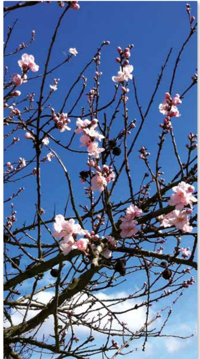
Titelbild: Christusfenster; Bild: Dr. Manfred Schneider