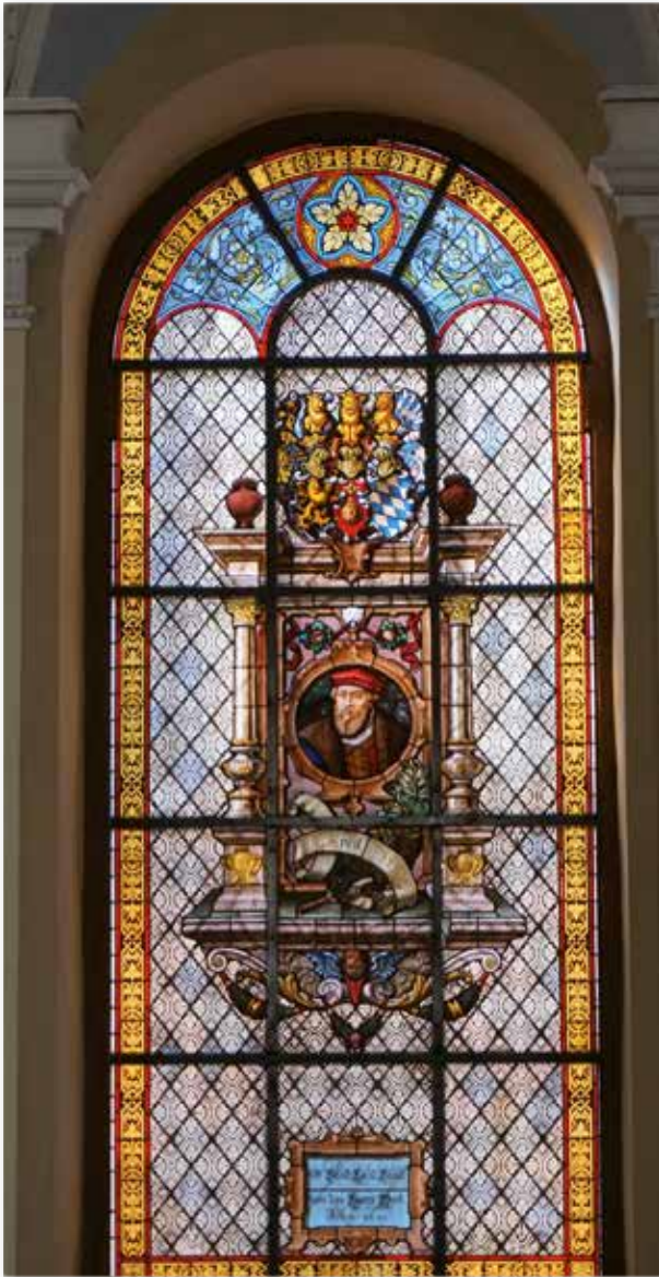
Kurfürst Ottheinrich unter der der Luther-Rose.

uns erfahrbar wurde. Schon für die Jünger Jesu war es zu jener Zeit kein Leichtes, an diese göttliche Verbindung des einen unter so vielen Menschen zu glauben. Durch seine Wohltaten, seine Wunder, seinen Leidensweg, seinen Tod und seine Auferstehung fanden die Menschen um Jesus jedoch zunehmend zum Glauben. Und so wie sich Jesus uns zugewandt hatte, so wissen wir im festen Glauben an die uns von ihm vermittelte Wahrheit, dass wir auch Gott nicht gleichgültig sind, sondern er sich vielmehr um uns sorgt.