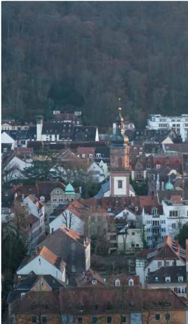
Die Providenzkirche. Einst ein lutherischer Gegenpol zum reformierten Bekenntnis der Heiliggeistkirche.

zur Providenzkirche passt, dürfte für das 200-jährige Bestehen der badischen Kirchenunion, die uns selbst mit der Fusion unserer Gemeinden von Heiliggeist- (reformiert) und Providenzkirche (lutherisch) ganz wesentlich betrifft, ein erfreulicher Umstand sein.