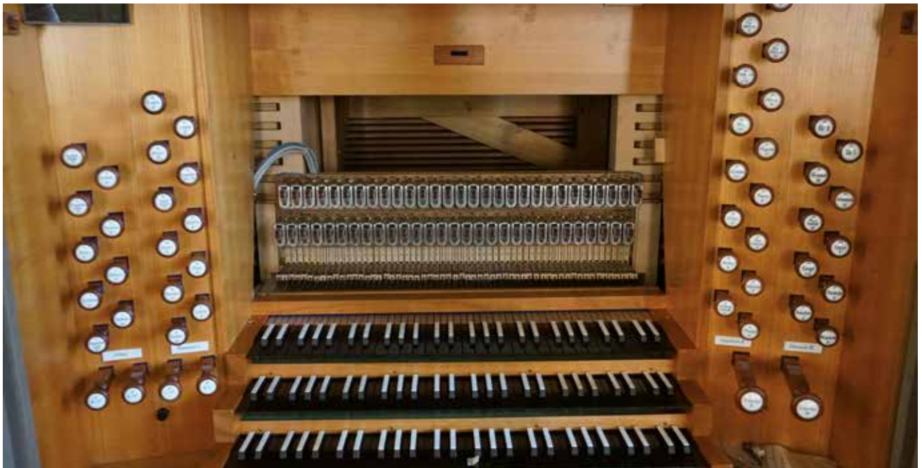
Hinter dem Pult steckt eine komplexe Elektronik.