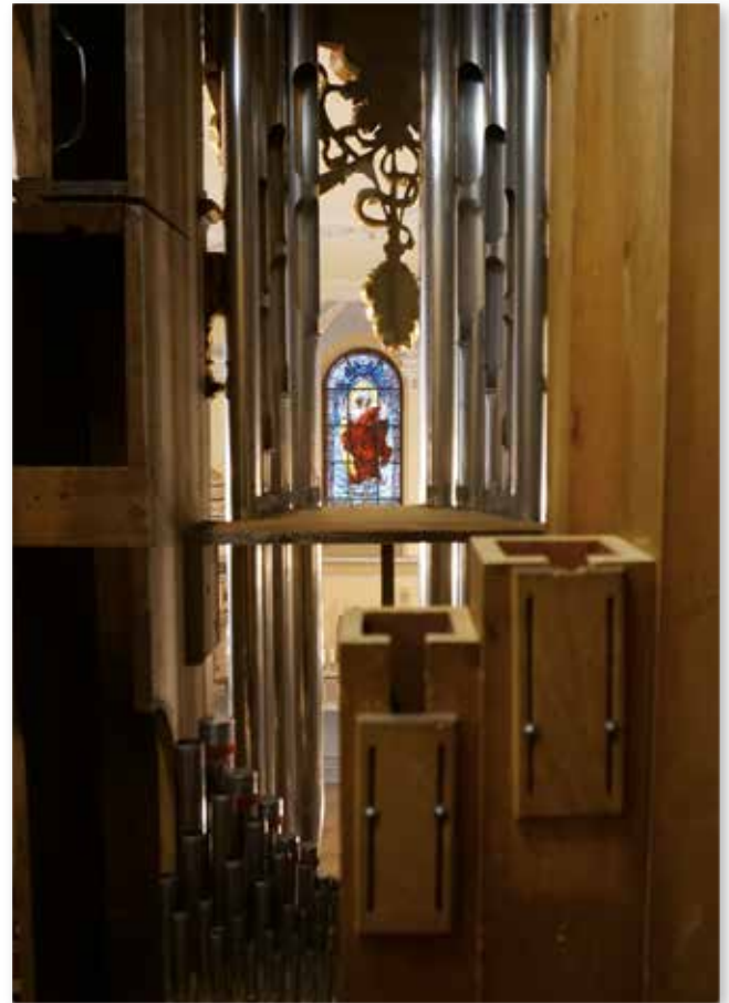
Ein Blick aus dem Inneren des Orgelhauses durch die zum Teil ausgehängten Orgelpfeifen auf das Christusfenster.