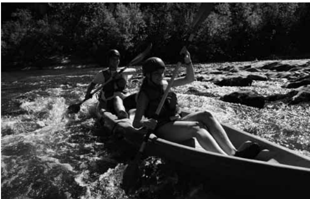
Ausgiebige Kanu-Touren auf dem Gebirgsfluss Hérault, inkl. Stromschnellen und kleinen Wasserfällen.