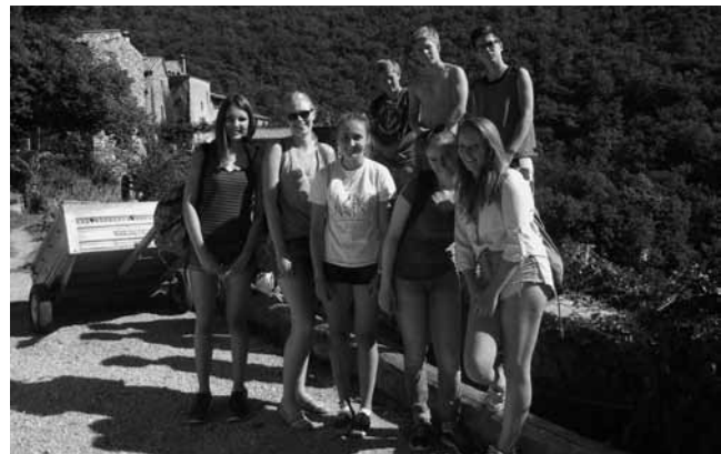
Es gab herrliche Ausflüge in verträumte Gebirgsdörfer ...