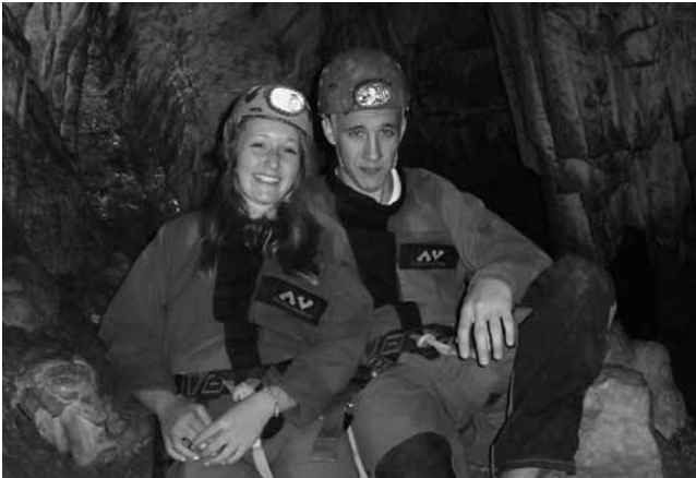
Immer ein Highlight: Höhlenklettern!