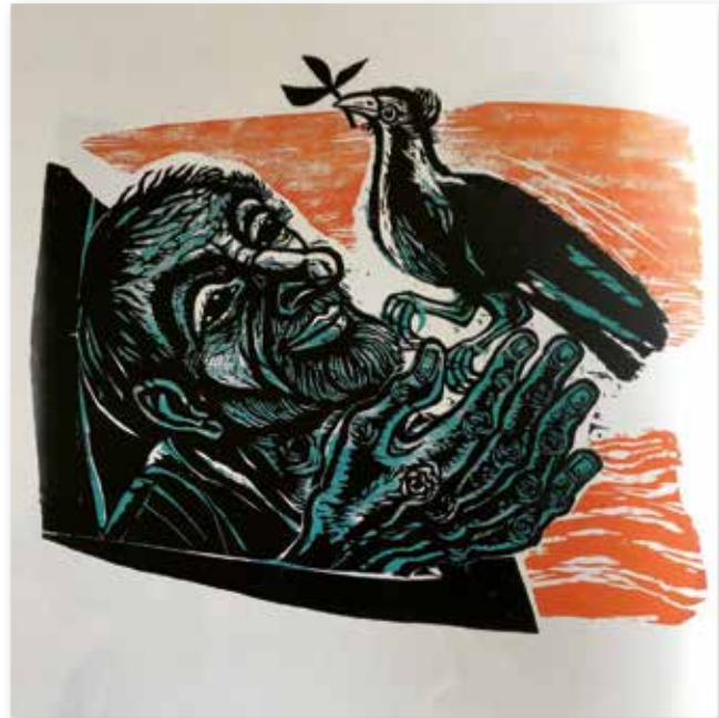
Bild: Walter Habdank, aus: Tief ins Holz geschnitten, Richard Riess, Athena Verlag 2022

Gehe also in die Arche hinein, Du und Deine Söhne, Deine Frau und die Frauen Deiner Söhne mit Dir. Von allen lebendigen Wesen nimm je zwei mit hinein, um sie mit Dir