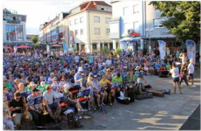
Posaunentag in Bruchsal 2019

Soviel ich weiß, sind die Gesangs-, Kirchen-, und vor allem die Posaunenchor die aktivsten Gruppen in der Landeskirche. Wir z. B. als Posaunenchor können uns außerdem bei Wind und Wetter überall aufstellen und die frohe Botschaft von Jesus Christus verkünden.