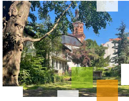
Der Garten der Providenzkirche Heidelberg

Wir fördern bürgerliches Engagement für den Stadtteil und seine Menschen konfessionsübergreifend.