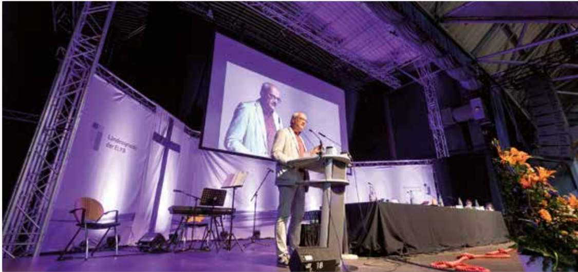
Impuls auf dem Thementag der Landessynode der Evangelisch-Lutherischen Kirche in Bayern, Mai 2022

ihrer Nachbarschaft so zu verändern, dass sie endlich in die Kirche kommen, sondern sie öffnet und verändert sich selbst so, dass die Kirche endlich in der Nachbarschaft ankommt.