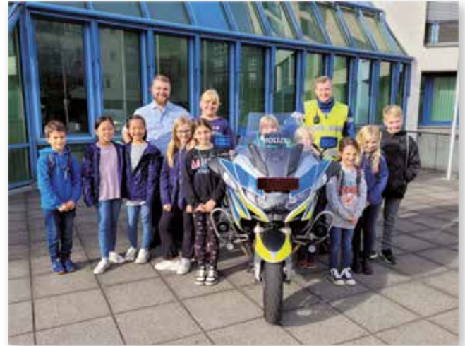
Ferienprogramm Führung für Grundschul Kinder durch das Polizeirevier Mitte

Wie bereits in der letzten Frage angemerkt, haben sich in den letzten Jahren (und nicht nur eben durch die Pandemie!) die Interessen und Vorlieben bei den Gästen deutlich verändert. Brettspiele, Kartenspiele, Tischtennis, Kickern oder Billard werden nicht mehr so häufig gespielt wie früher,