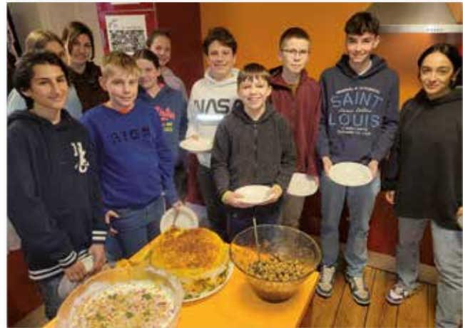
Küche des Orients mal vegan

Wenn ich euch vor 5 Jahren gefragt hätte: Was ist eure Zielsetzung bei CityCult, was hättet Ihr gesagt? Und wie antwortet