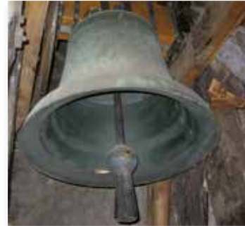
Die Glocke der Providenzkirche

Im 1. Weltkrieg mußten diese fünf Glocken zur Herstellung von Munition abgegeben werden. Für einige Jahre gab es zwei Notglocken, bis man in den 1920er Jahren wieder ein vollwertiges Läutewerk installieren konnte.