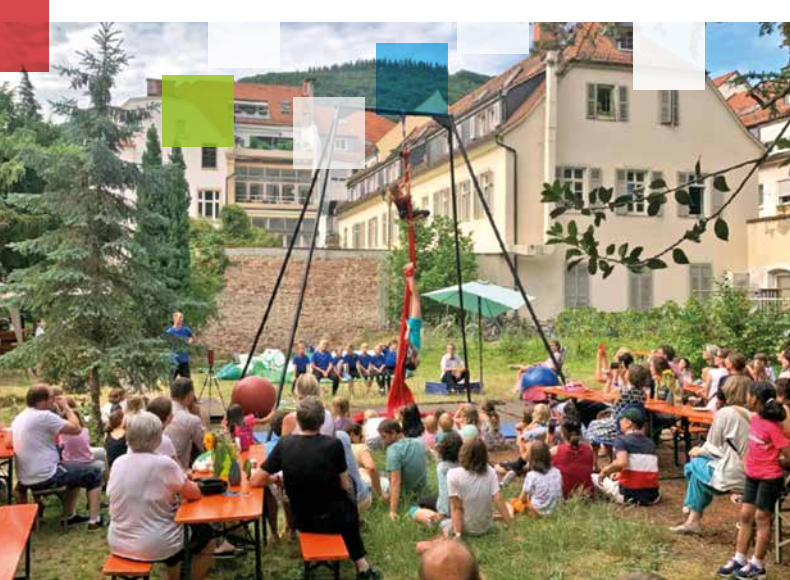
Der Kinderzirkus Esperanza im Garten der Providenzkirche Heidelberg