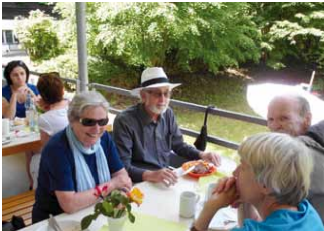
Auf dem Balkon schmeckt es am besten!