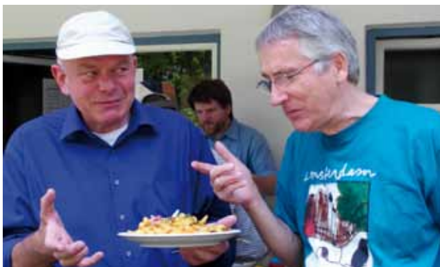
Vor dem Essen noch ein Plausch...