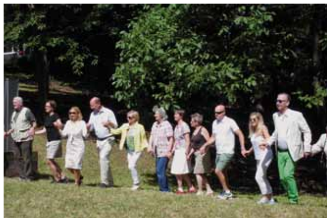
Auf die Tanzhaltung kommt es an!