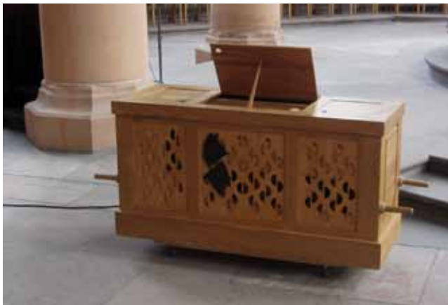
Die neu restaurierte Truhensorge