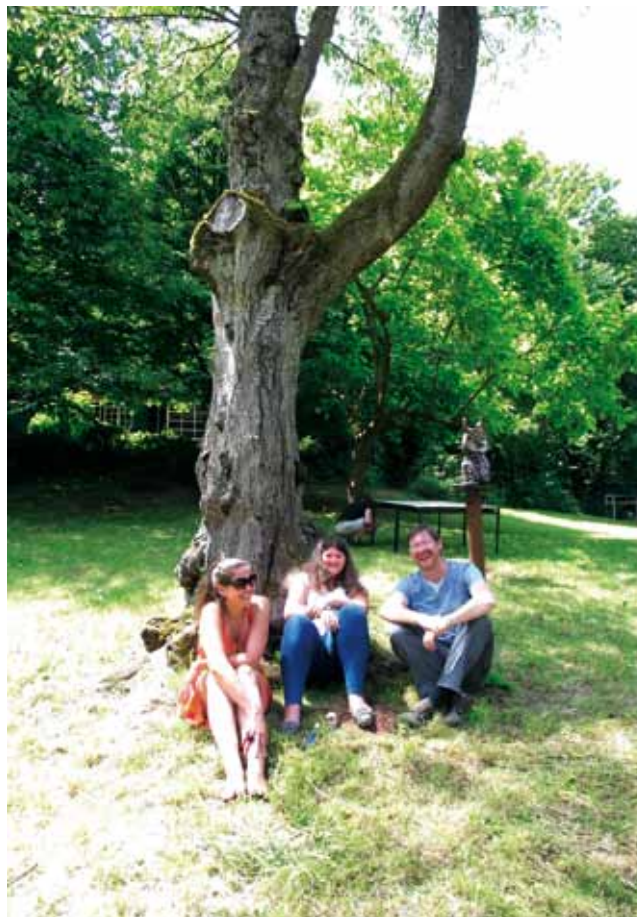
Nach dem Essen im Gras sitzen – ein Genuss!

Siehe auch Bericht auf der nächsten Seite.