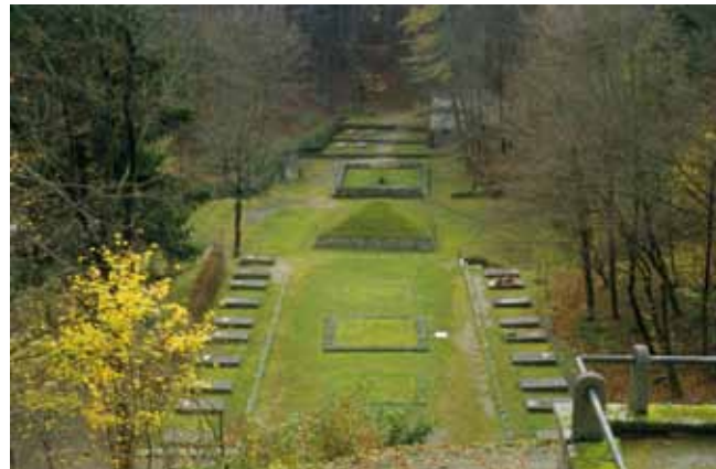
Gedenkstätte im KZ Flossenbürg; Foto: panoptikum.net