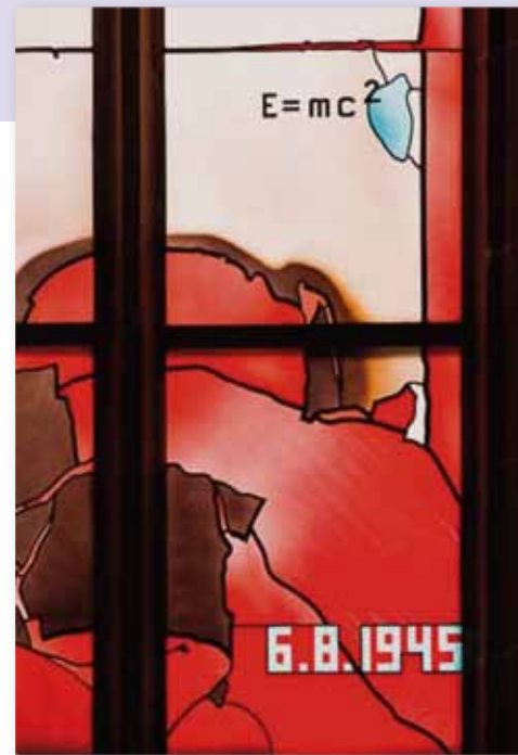
Das „Physikfenster“ in der Heiliggeistkirche erinnert an den Abwurf der ersten Atombombe