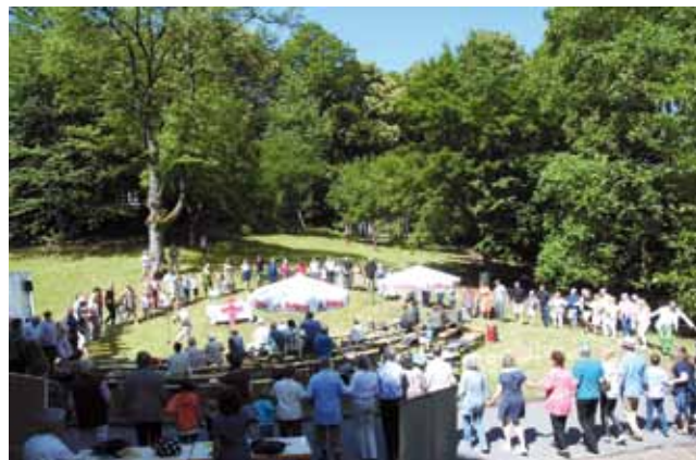
Na sowas, ein Tanz beim Gottesdienst!