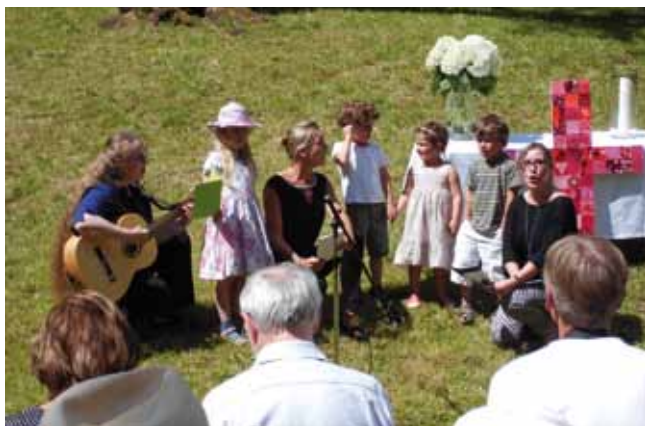
Weil ich Jesu Schäflein bin ...