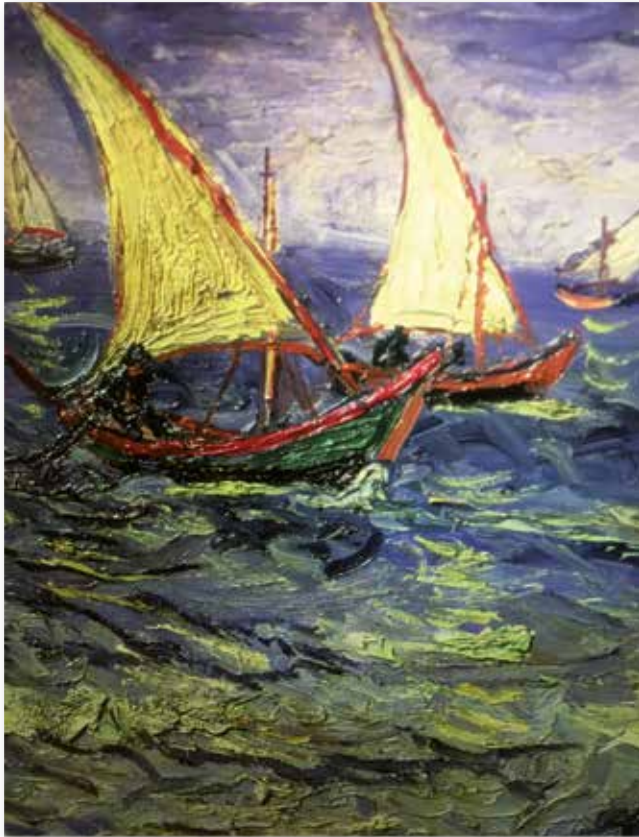
Vincent van Gogh, Fischerboote auf dem Meer bei Saintes-Maries

immer größer, immer mehr, immer mächtiger entwickelt und wäre sie zufrieden gewesen. Wäre sie doch nur einmal bei einem „Ja, so ist es gut!“ geblieben, wäre die Geschichte nicht in der Katastrophe geendet.