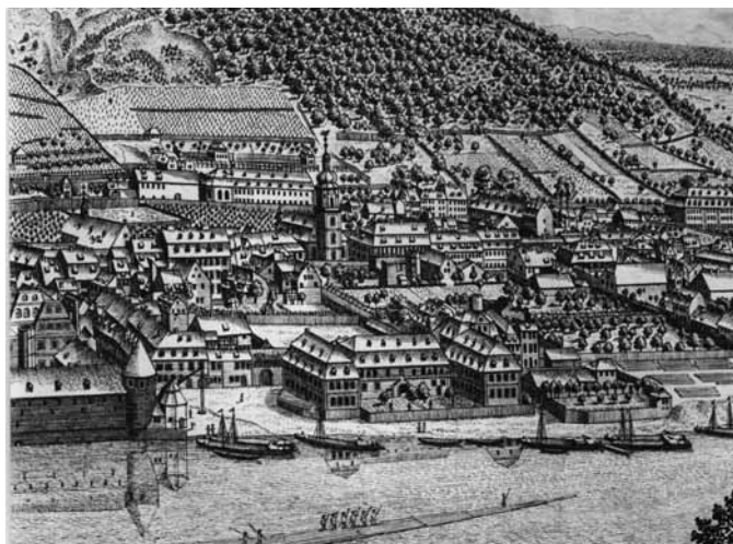
Heidelberg-Ansicht von 1763 mit der „neuen“ Providenzkirche

Am 21. August werden wir in Providenz eine evangelische Messe feiern, in Erinnerung an die Einweihung der Kirche auf den Tag genau vor 350 Jahren. Aber: Ist eine Messe nicht katholisch?