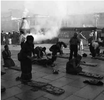
Betende Pilger im Jokhang-Tempel in Lhasa

tibetischen Buddhismus mit dem Hauptwallfahrtsort Lhasa. In buddhistischen Ländern pilgert man oft zu geschichtsträchtigen Tempeln oder Klöstern. Die Einhaltung von Fastenvorschriften, Erschwernisse und das Rezitieren von Mantras während des Pilgerns sollen die Chance auf eine gute Wiedergeburt oder Segnungen erhöhen.