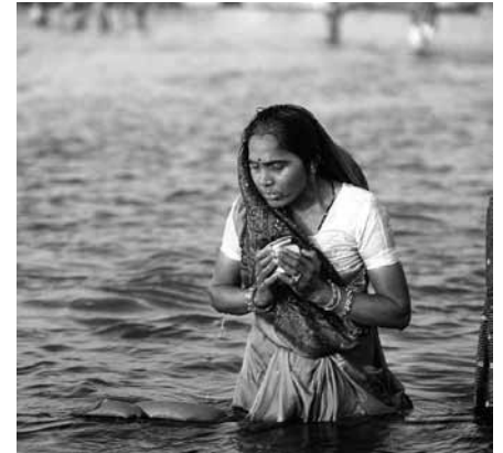
Reinigende Waschung im Ganges

Jeder Hindu soll einmal im Leben zum heiligen Fluss Ganges pilgern. Er verkörpert die Kraft der Götter. Sein Wasser ist heilig. Laut der indischen Mythologie wurde der Fluss den Menschen von der Fruchtbarkeitsgöttin Ganga geschenkt. Ein Bad im Ganges soll die Menschen von ihren Sünden befreien. Viele Gläubige pilgern nach Vara-