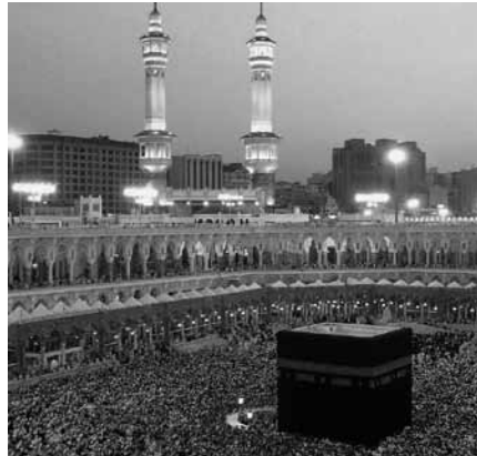
Mekka – das zentrale Heiligtum der Muslime

Eine Wallfahrt nach Mekka zählt zu den fünf Grundpflichten eines erwachsenen Moslems. Bereits der Reise gehen zehnwöchige rituelle Vorbereitungen voraus. Bevor die