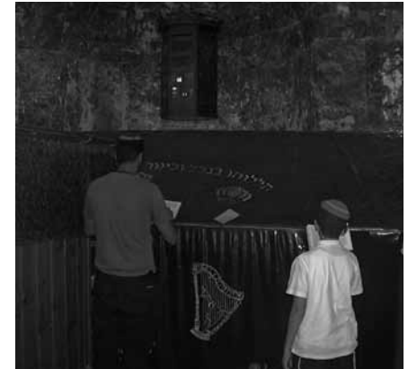
Fromme Juden am Grab Davids in Jerusalem

Im traditionellen Judentum sind die Wallfahrten eng mit den drei