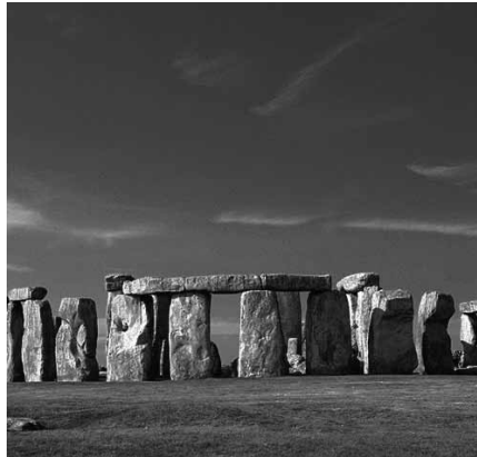
Stonehenge in Südengland

Pilgern ist eine Bewegung auf etwas hin. Alle Weltreligionen erkennen in der Reise zu bestimmten Wallfahrtsorten eine tiefenwirksamere Begegnung mit ihrer Gottheit, die ihren Höhepunkt in verschiedenen rituellen Handlungen am Zielort findet. Einige dieser Orte haben bereits vor ihrer Vereinnahmung durch eine der Weltreligionen als solche „Kraftzentren“ fungiert. So wurde das Zentrum der islamischen Wallfahrt nach Mekka, die Kaaba, schon von den alten arabischen Stämmen als Heiligtum