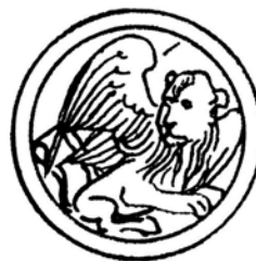
Markus = Löwe