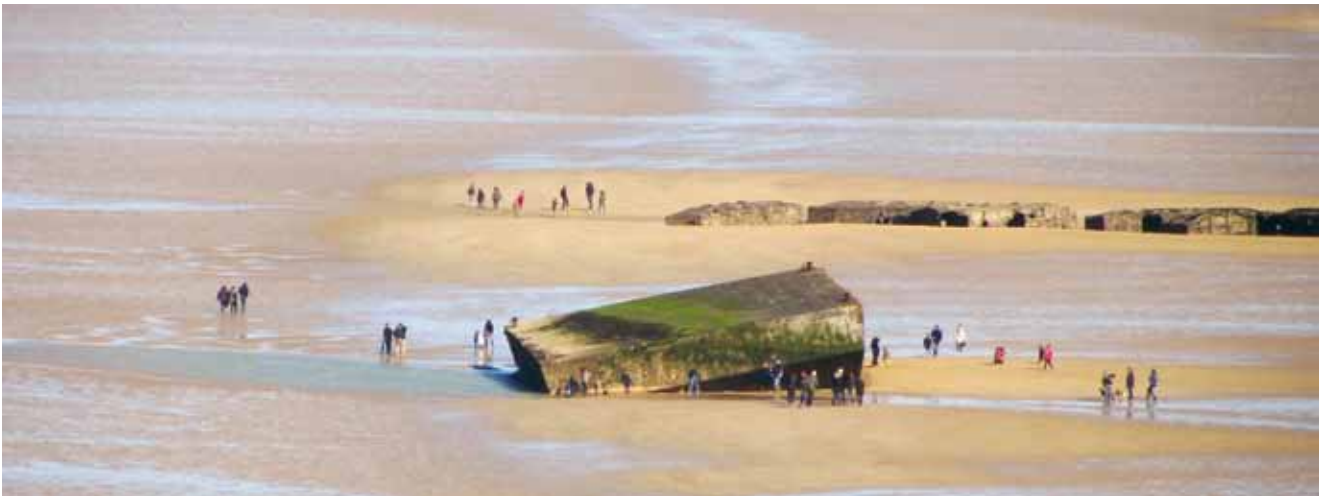
Relikt eines provisorischen Hafens in der Westnormandie, hier setzten die Alliierten am 6. Juni 1944 unerwartet auf europäisches Festland über, ein Meilenstein auf dem Weg der „Befreiung“.