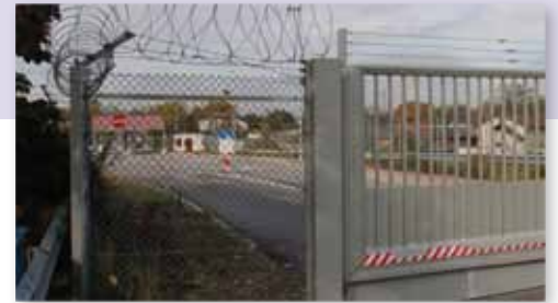
Eingangstor zum PHV

Natürlich hat sich das im Laufe des Jahres geändert. Je bekannter wir wurden, umso mehr Anfragen erreichten uns. Und so waren wir dann doch froh, als wir unser Seelsorgezimmer in der Chapel einrichten konnten. Hier hören wir von unglaublichen Fluchtgeschichten und grenzenlosem Heimweh. Wir sehen Fotos von Kindern, die noch in der Heimat sind, und die Tränen, die aus Sorge um sie geweint